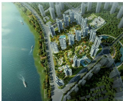
江誉诚五期总平面示意图

若将目前热销全城，定义“为超越而来”的江誉诚三期比喻为翡翠玉石，那么，五期项目可形容为皇冠上的钻石明珠。五期项目将打造成江境传奇之作，成就一个瞰江揽园的城市封面作品，重新定义江岸豪宅标杆。