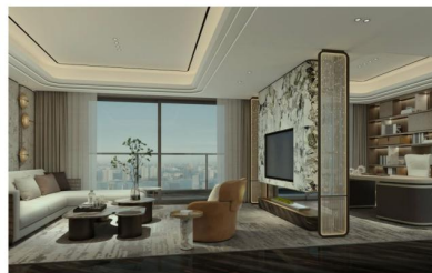
180平米样板房客厅效果示意图

五期项目展示区将精雕细琢重点打造160平方米及180平方米两大主力户型江景大平层样板房，此两个户型均享有大阳台、宽阔景观，最大约超8米江景宽境大阳台，开阔视野之下，可邀宾客共享城市的繁华景致；270°天际景观，将明媚阳光与清新空气引入室内，温暖诗意在此尽享，休憩时分盛景尽收眼底。