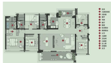
180平米大平层样板房户型平面示意图