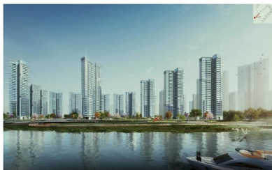
江誉诚五期建筑外立面示意图

五期项目将倾力打造全景塔式楼栋建筑。为了保证品质和视野，采用“U”型半围合总平设计，确保户户采光均匀及通风南北对流。项目以高标准打造现代风格建筑外立面。统一使用高端石材干挂、定制铝板及品牌瓷砖，整体采用现代建筑风格，立面呈现出现代线条感，空调机位统一隐藏，干净利落，明快大气。