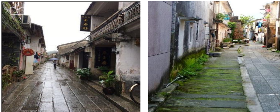
图 1、2 古城一角

穿过一排排郁郁葱葱的小香樟树，我们按照行程的远近，率先去了大鹏古城。不同于民族风味浓郁的大理古城，也不同于历史底蕴深厚的凤凰古城，被大雨倾洒过的大鹏古城更像是一个犹抱琵琶半遮面的害羞少女。雨水过后升腾而起的雾气和湿润未干的石块地板以及呼吸间肺腑吸取的凉意，无不让人感受到一股清新。有别于特意营造的古风古色，大鹏古城更像是小时候外婆带着走过的老街，纯朴，亲昵。